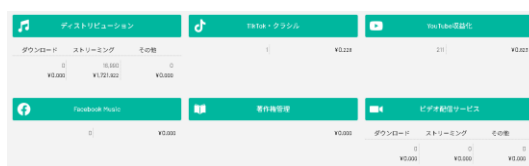
図2 music サブスクの収益

図2の通り、現在無名のアーティストということもあり、YouTubeチャンネルは音楽ジャンルの公式マークが付与されたとはいえ、収益が非常に大きいわけではありません。この図は累計収益額で、2024年度11月から2025年度1月までの確定収益の表になります。引き出し最低金額には達しているものの、有効期限は存在しないので、まだまだ粘るつもりです。Musicの宣伝は、YouTubeやSNSのショート動画を使った宣伝が大半ですが、残念ながら直近ではそれがうまくできていなかったもので、何か自分でトレンドを巻き起こせる何かを作りたいですね。直近の考えではショート動画や小説ドラマ制作による楽曲の利用からセルフで収益を得るといった感じですね。今後も新曲を出すのでお楽しみに。後いっぱい聞いてくれると嬉しいです。